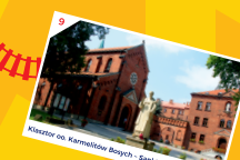
Klasztor oo. Karmelitów Bosych - Sanktuarium św. Józefa