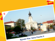
Rynek Plac Jana Pawła II