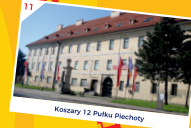
Koszary 12 Pułku Piechoty