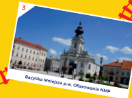
Bazylika Mniejsza p.w. Ofiarowania NMP