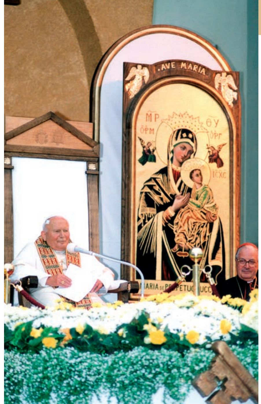
Jan Paweł II w Wadowicach – trzecia wizyta, 16.06.1999 r.