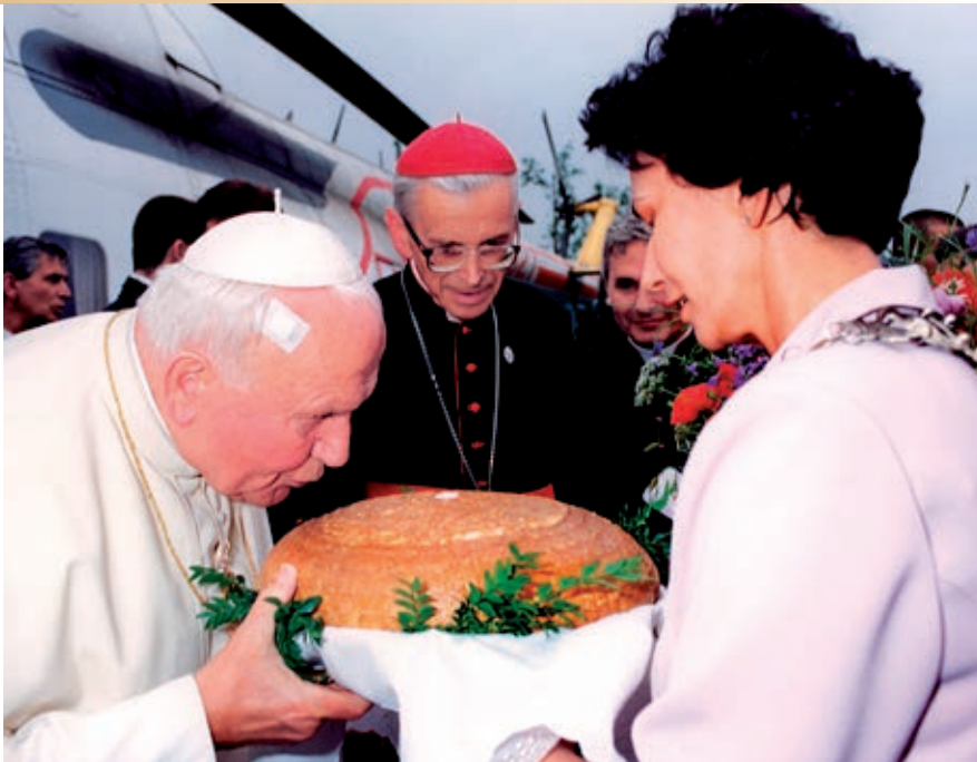
Jan Paweł II w Wadowicach – trzecia wizyta, 16.06.1999 r. Powitanie chlebem i solą w rodzinnym mieście.

Z głęboką czią cauję też próg domu Bożego – wadowickiej fary, a w niej chrzcielnicę, przy której zostałem wszczepiony w Chrystusa i przyjęty do wspólnoty Jego Kościoła. W tej świątyni przystąpiłem do pierwszej spowiedzi i Komunii św. Tu byłem ministrantem. Tu dziękowałem Bogu za dar kapłaństwa i – już jako arcybiskup krakowski – tu przeżywałem swój srebrny jubileusz kapłański. Ile dobra, ile łask wyniosłem z tej świątyni i z tej parafialnej wspólnoty, wie jedynie Ten, który jest Dawcą wszelkich łask. Jemu, Bogu w Trójcy jedynemu, oddaję dziś chwałę na progu tego kościoła.