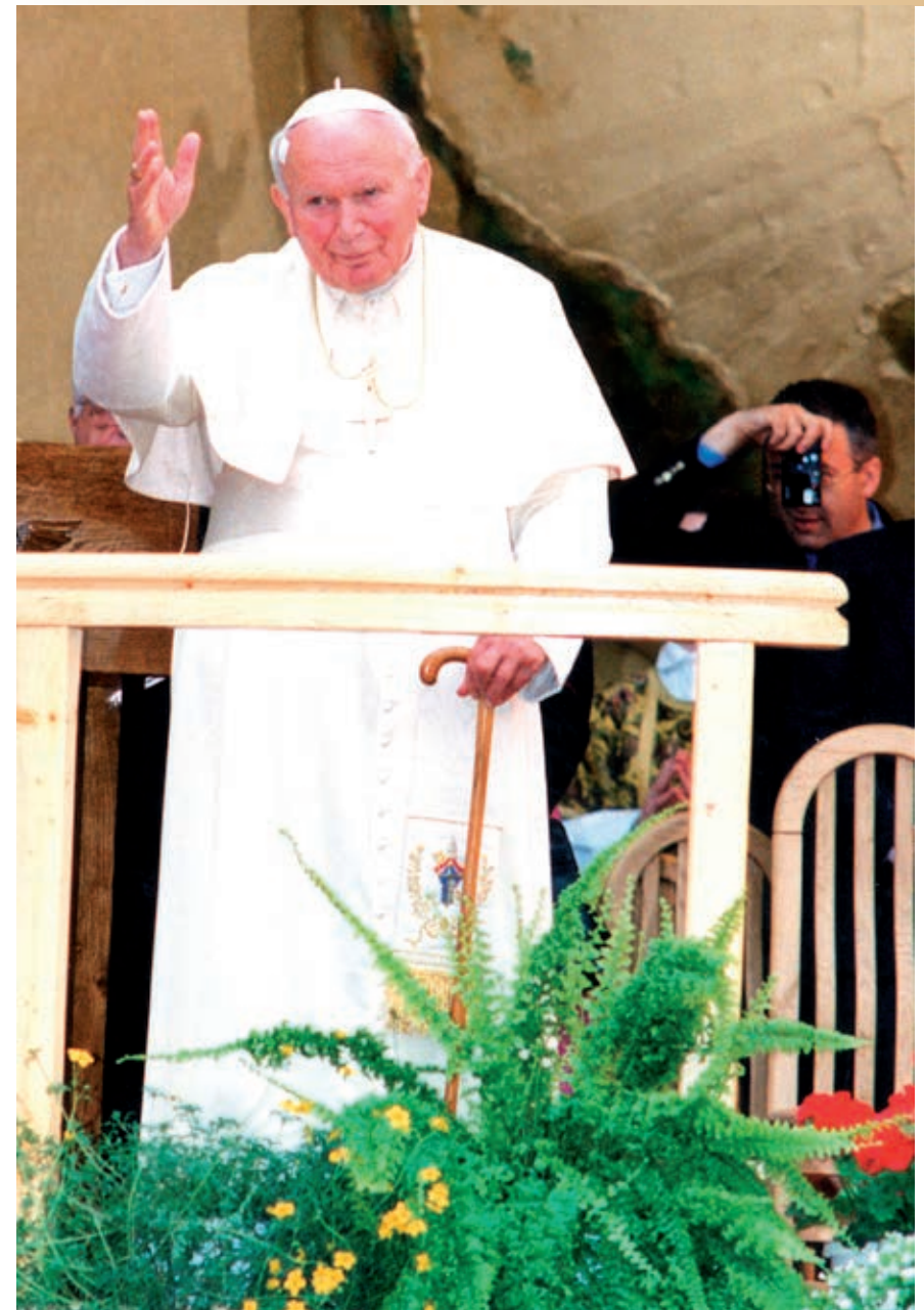
Jan Paweł II w Wadowicach – trzecia wizyta, 16.06.1999 r.