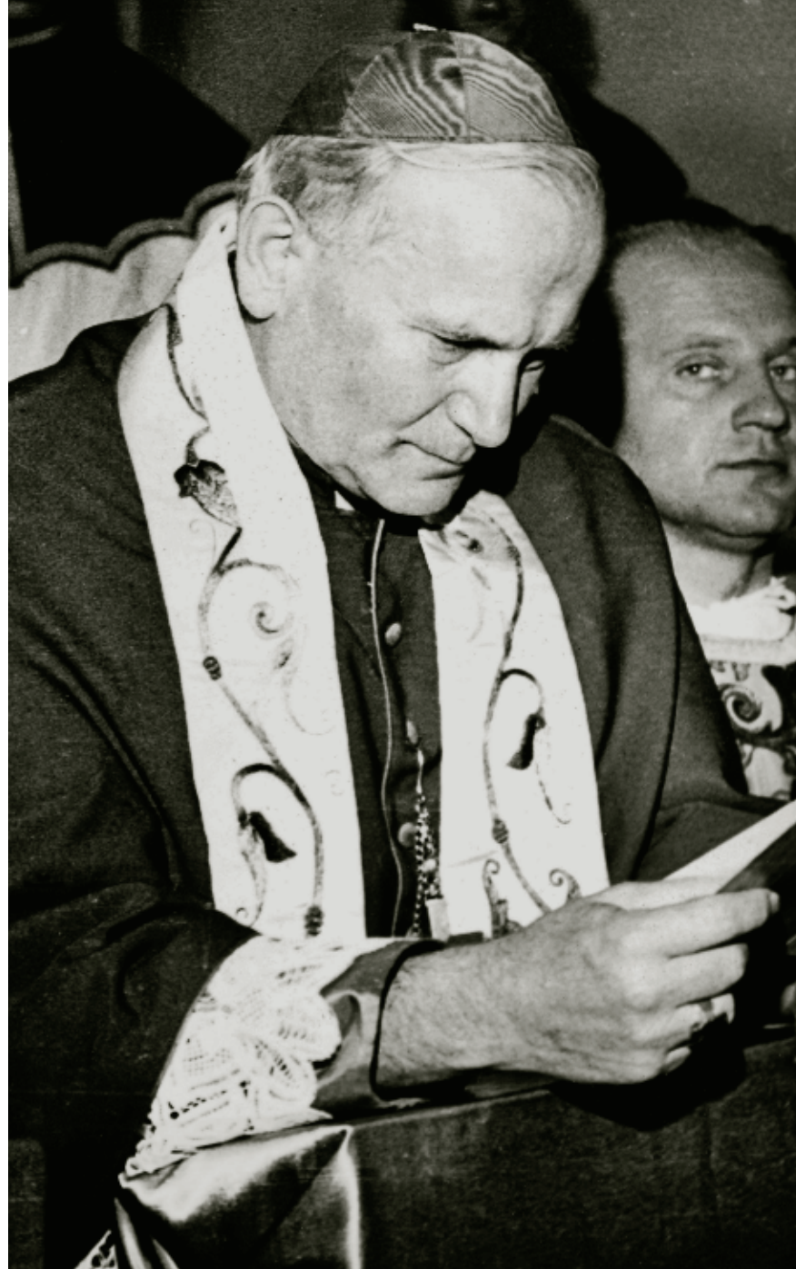
Kardynał Karol Wojtyła podczas wizyty w Wadowicach