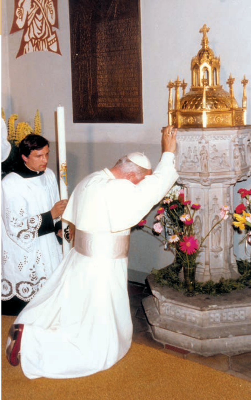
Jan Paweł II w Wadowicach – pierwsza wizyta, 07.06.1979 r.