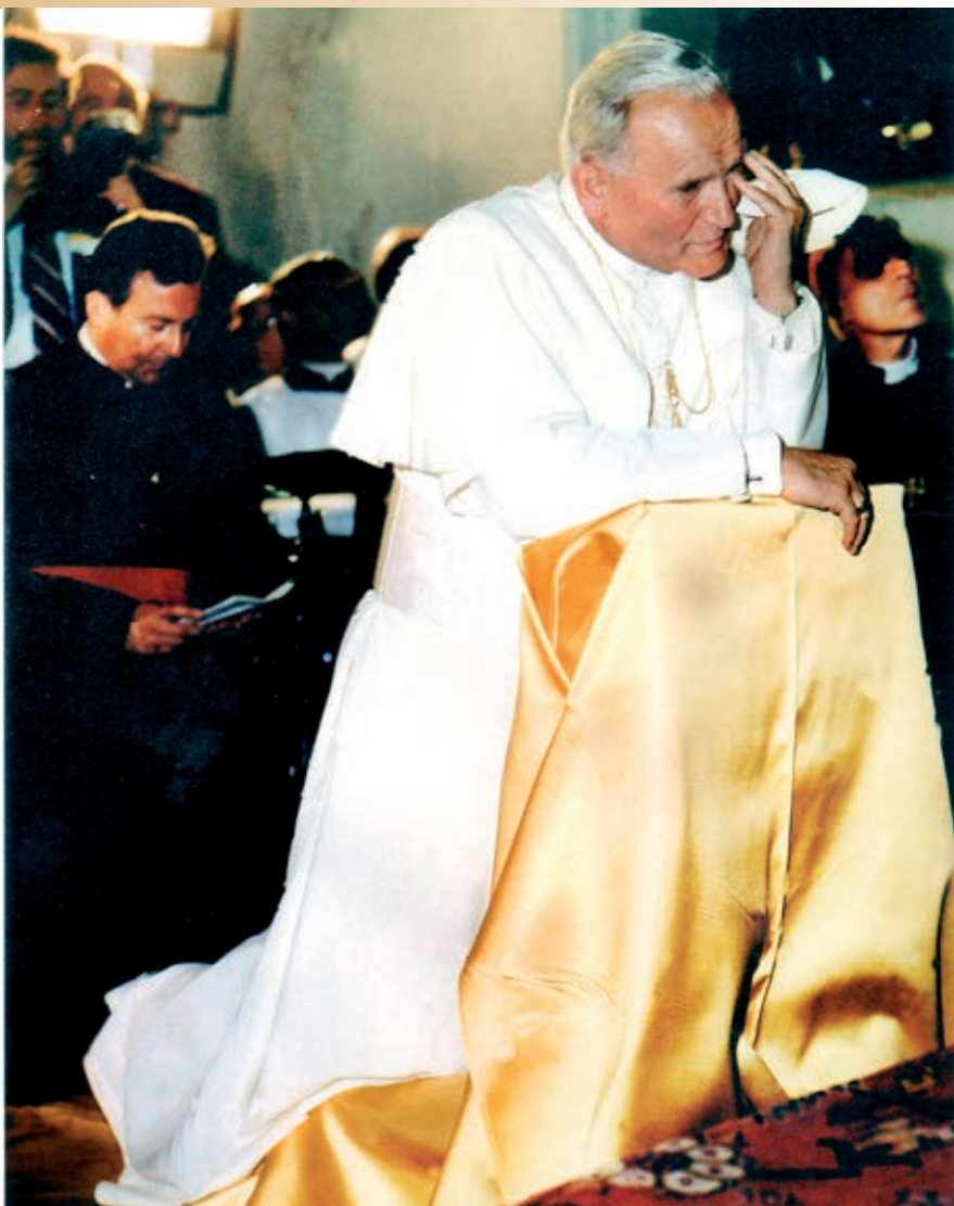
Jan Paweł II w Wadowicach – pierwsza wizyta, 07.06.1979 r.

Z wielkim wzruszeniem przybywam dzisiaj do tego miasta, w którym się urodziłem – do parafii, w której zostałem ochrzczony i przyjęty do wspólnoty Kościoła Chrystusowego – do środowiska, z którym związałem się przez osiemnaście lat mojego życia, od urodzenia do matury.