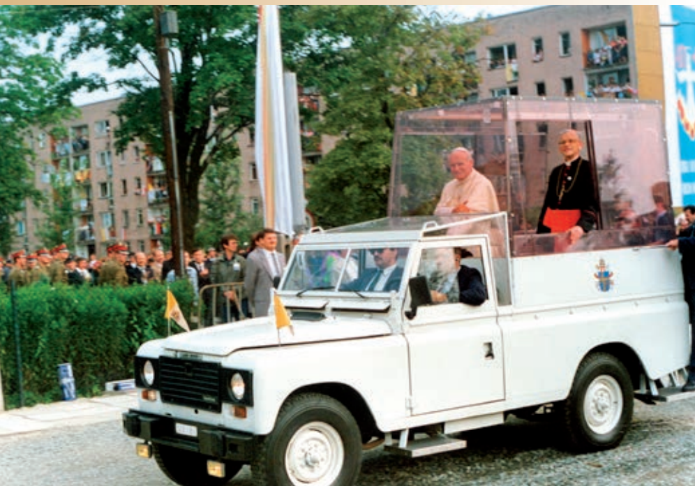
Jan Paweł II w Wadowicach – druga wizyta, 14.08.1991 r.