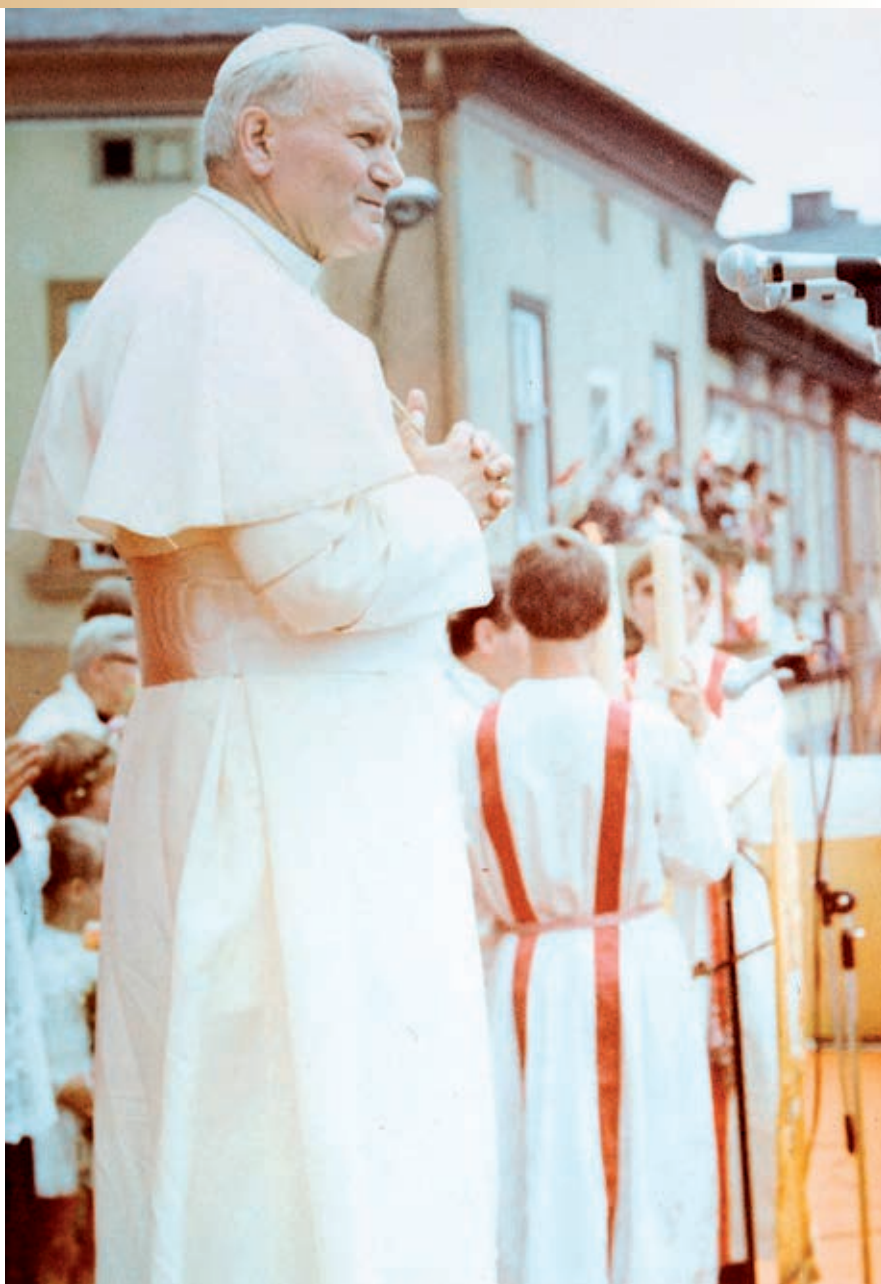
Jan Paweł II w Wadowicach – pierwsza wizyta, 07.06.1979 r.