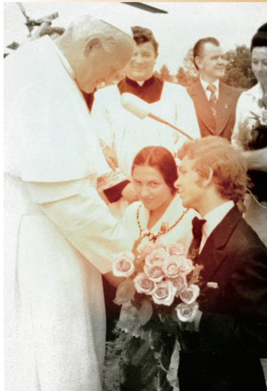
Jan Paweł II w Wadowicach – pierwsza wizyta, 07.06.1979 r.