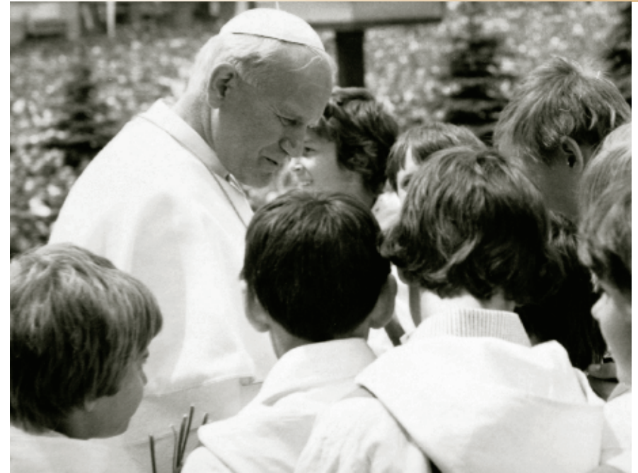
Jan Paweł II w Wadowicach – pierwsza wizyta, 07.06.1979 r.

Kiedy patrzę wstecz, widzę, jak droga mojego życia poprzez środowisko tutejsze, poprzez parafię, poprzez moją rodzinę, prowadzi mnie do jednego miejsca, do chrzcielnicy w wadowickim kościele parafialnym. Przy tej chrzcielnicy zostałem przyjęty do łaski Bożego synostwa i wiary Odkupiciela mojego, do wspólnoty Jego Kościoła w dniu 20 czerwca 1920 roku. Chrzcielnicę tę już raz uroczyście ucałowałem w roku tysiąclecia chrztu Polski jako ówczesny arcybiskup krakowski. Potem uczyniłem to po raz drugi, jak przypomniał ksiądz prałat, na 50 rocznicę mojego chrztu, jako kardynał, a dzisiaj po raz trzeci ucałowałem tę chrzcielnicę, przybywając z Rzymu jako następca św. Piotra.