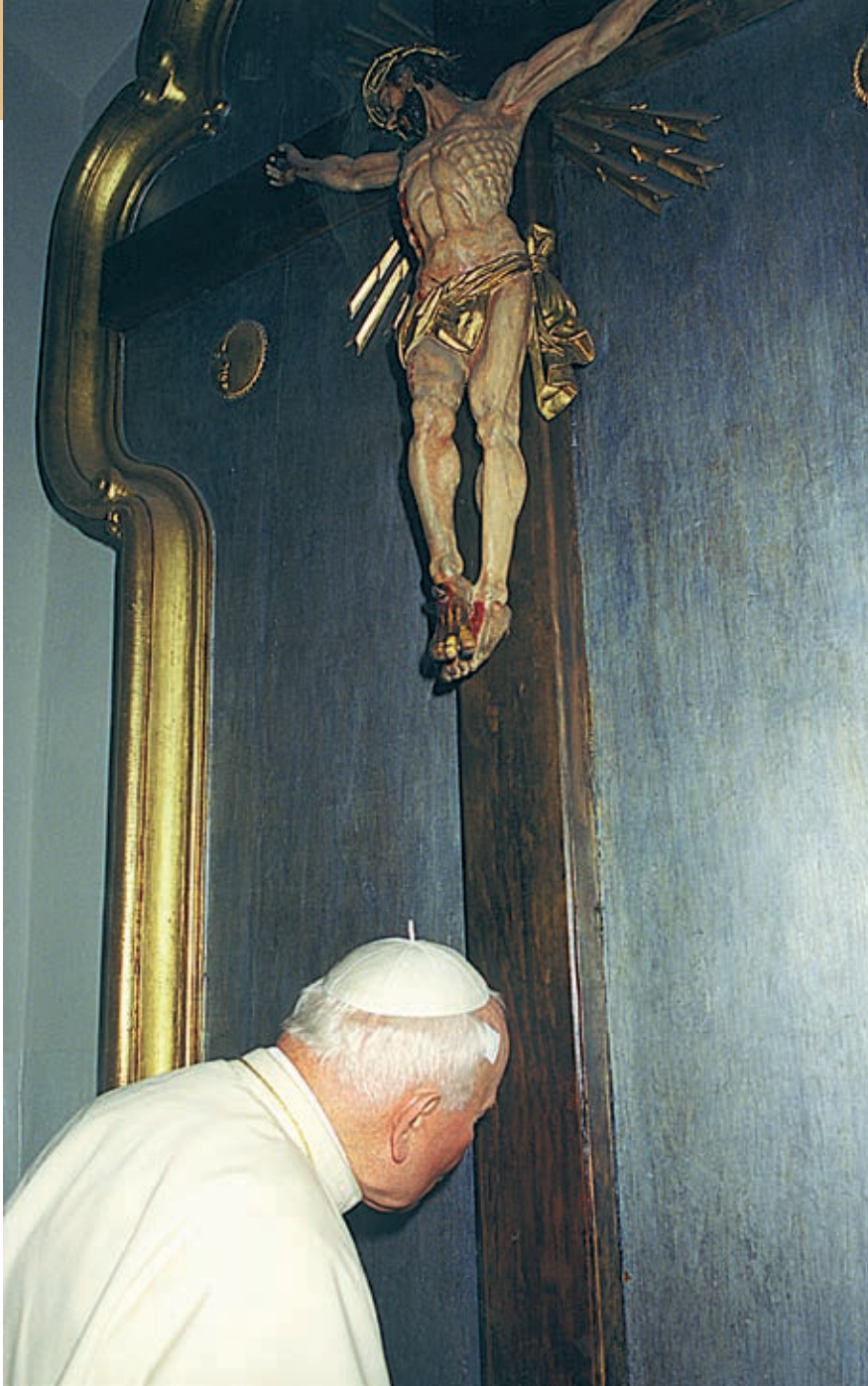
Jan Paweł II w Wadowicach – trzecia wizyta, 16.06.1999 r.