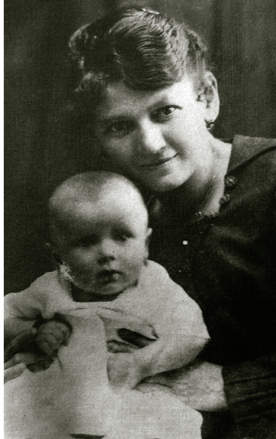
Karol Wojtyła na rękach matki Emilii