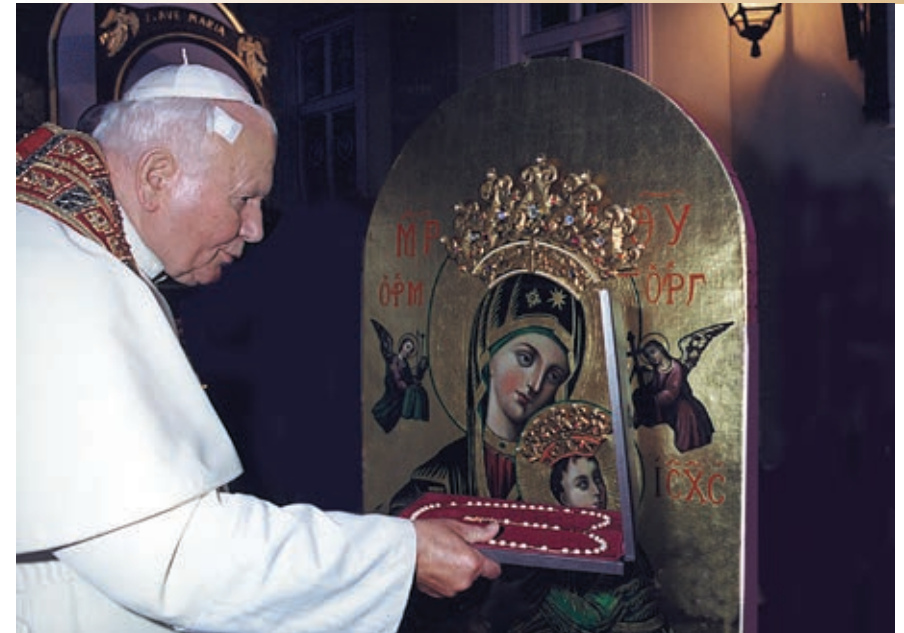
Jan Paweł II w Wadowicach – trzecia wizyta, 16.06.1999 r.

Podczas mego pierwszego pobytu w Wadowicach skierowałem do was prośbę, abyście przed wizerunkiem tej Matki otaczali mnie nieustanną modlitwą. Widzę, że została ona wykuta w kamieniu. Wierzę, że jest to znak, iż ta prośba jest głęboko wryta również w waszych sercach. (okrzyki: Pamiętamy...) [Serdecznie dziękuję wam za modlitwę.] Stale odczuwam jej działanie i nadal gorąco o nią proszę.