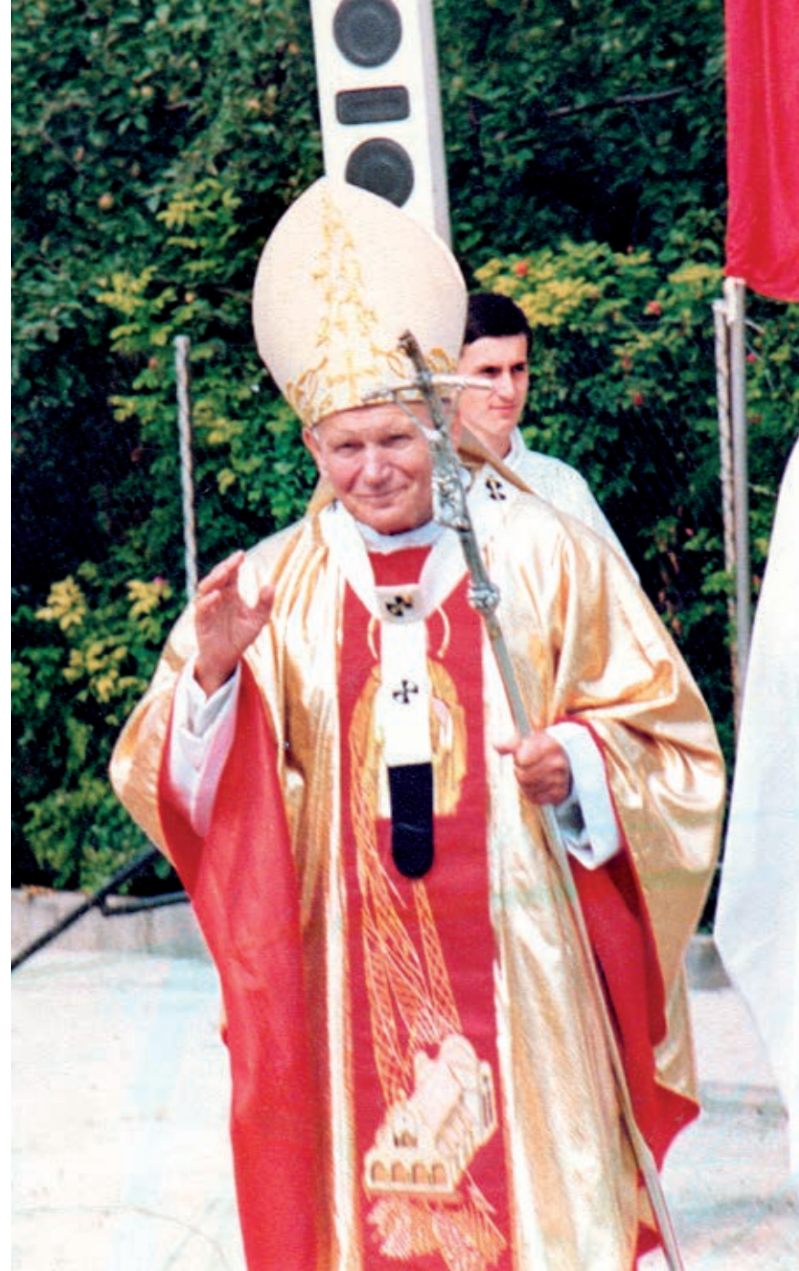
Jan Paweł II w Wadowicach – druga wizyta, 14.08.1991 r.