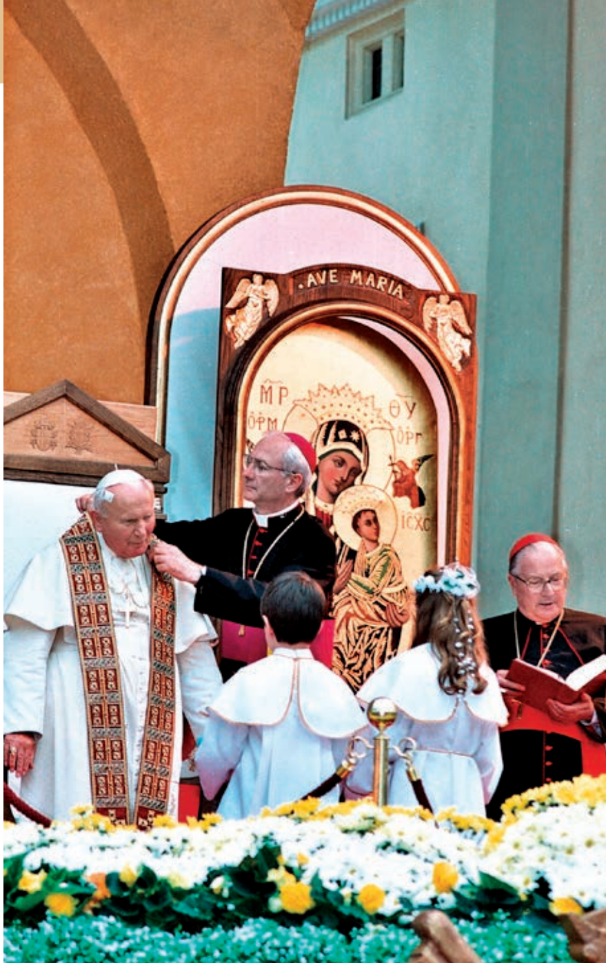
Jan Paweł II w Wadowicach – trzecia wizyta, 16.06.1999 r.