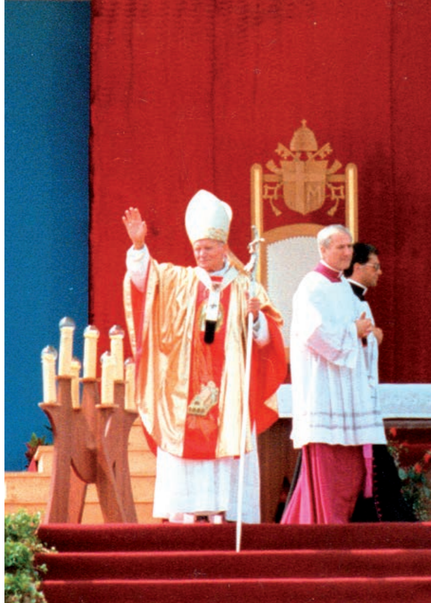
Jan Paweł II w Wadowicach – druga wizyta, 14.08.1991 r.

Błogosławiony bądź, Piotrze, w sposób szczególny w tej nowej świątyni, która pod twym imieniem została dziś poświęcona i oddana Bogu Żywemu na chwałę Trójcy Przenajświętszej.