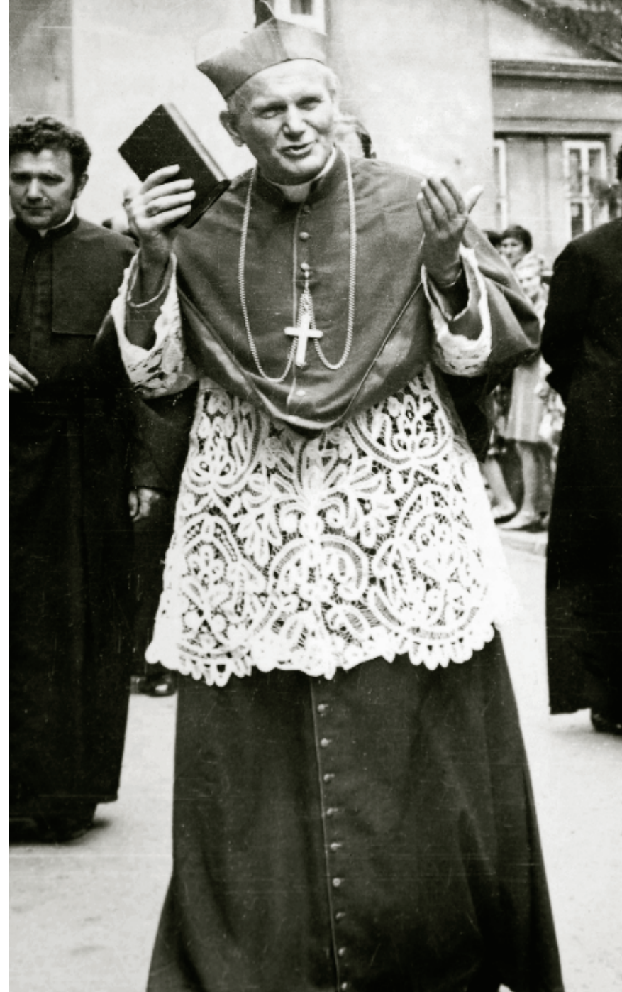
Kardynał Karol Wojtyła w Wadowicach – wizyta duszpasterska Fot. [Andrzej Leń]