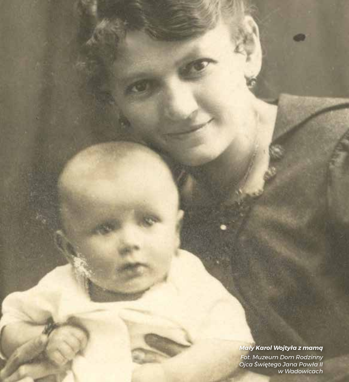
Mały Karol Wojtyła z mamą

Jakże wdzięczny ci jestem moja matko i mój ojciec, i mój bracie! (...) Jakże wam wdzięczny jestem za to największe „wtajemniczenie”. Wszystko z czego czerpię swój ostateczny sens.