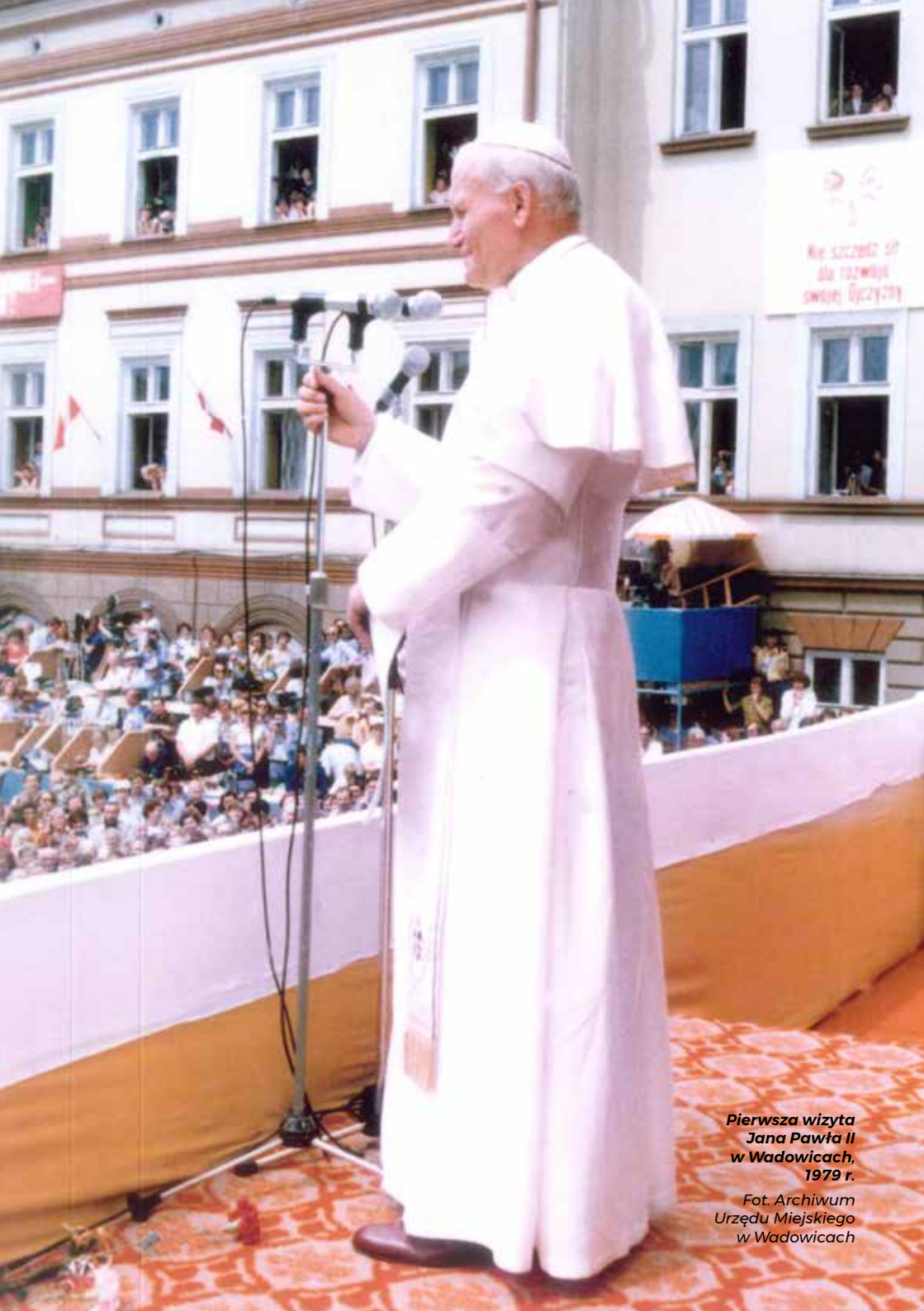
Pierwsza wizyta Jana Pawła II w Wadowicach, 1979 r.