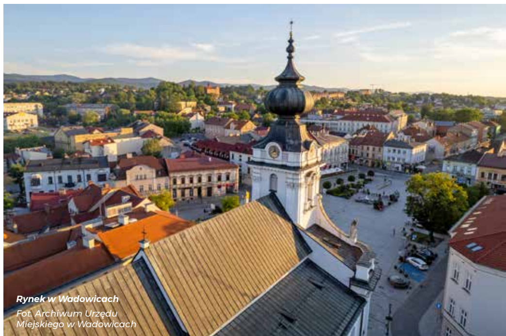
Rynek w Wadowicach