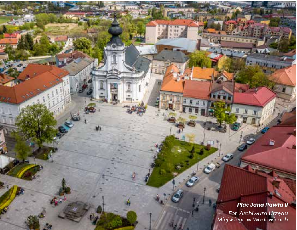
Plac Jana Pawła II

W pierwszym roku pontyfikatu Jan Paweł II zapowiedział, że odbędzie się procesja Bożego Ciała ulicami Rzymu. Od dawna jej nie było. Kolejne miesiące były bardzo napięte. Cała strona laicka Rzymu bardzo mocno sprzeciwiała się temu wydarzeniu. Autorzy artykułów w codziennej prasie opowiadali się raczej przeciwko tej inicjatywie, jednak mimo to Papież stanowczo utrzymywał: procesja Bożego Ciała musi być! I odbyła się 17 czerwca. Uczestniczyłem w tej procesji i pamiętam, że atmosfera była bardzo napięta, było prawie tylu policjantów, co uczestników. Podziwiałem nie tylko jego męstwo, ale również jego miłość do Chrystusa Eucharystycznego, bo są sprawy, w których nie da się ustępować.