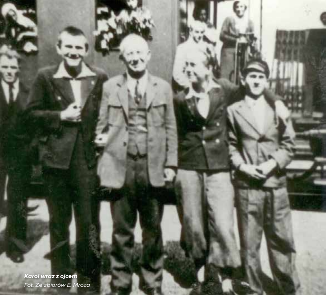
Karol wraz z ojcem

Lolek był uczniem, który wybijał się na tle klasy. [...] Na przerwie gdy inni rozbijają się, krzyczą - on zachowuje się spokojnie. Reaguje na każdą niewłaściwość w zachowaniu rówieśników. Był bardzo lubiany, chociaż przeciwdziałał wybrykom współtowarzyszy. Miał wycucie etyczne, wiedział co można a czego nie można. [...] Lolek jako bardzo zdolny, pilny uczeń - wyróżniał się.