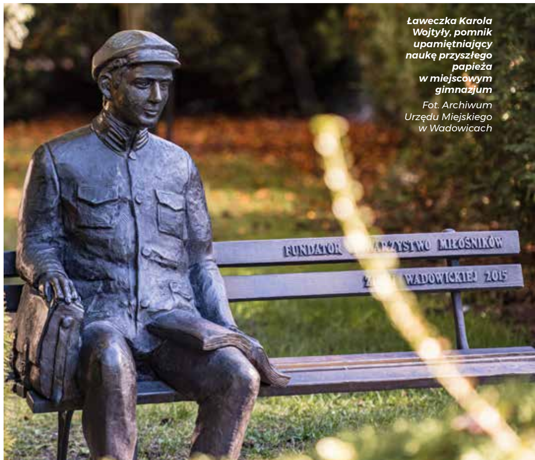
Ławeczka Karola Wojtyły, pomnik upamiętniający naukę przyszłego papieża w miejscowym gimnazjum

Urzekał prostotą, bezpośredniością i wielką radością życia, mimo że na jego dzieciństwo padł cień sieroctwa. (...) Lolek zaskakiwał nas, imponował, a zarazem onieśmielał swoją dojrzałością, wnikliwym filozoficznym spojrzeniem na wiele spraw, urzekała nas tkwiąca w nim głęboka prawość. Zadziwiał nas też umiarem, rozważą i pogodą w przyjmowaniu wszystkiego, co przynosiło życie. Z każdym łatwo nawiązywał kontakt, szybko stwarzał atmosferę bliskości i serdeczności.