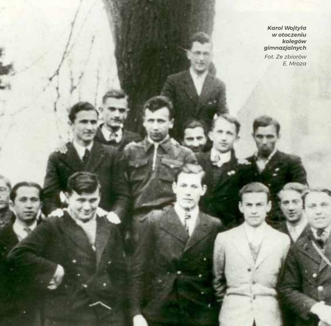
Karol Wojtyła w otoczeniu kolegów gimnazjalnych

Spotkałem normalnego człowieka, który nie myślał o sobie przez górne „c”. Normalny, rzeczowy, skromny, zapatrzony w to, czego szukał. A szukał prawdy. Takiej, która pomogłaby Polakom w Polsce żyć i odnaleźć siebie.