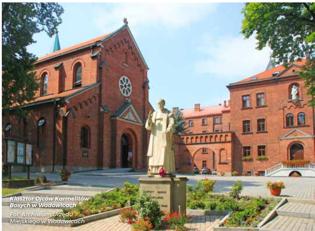
Klasztor Ojców Karmelitów Bosych w Wadowicach