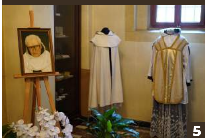
A Klasztorny kościół – Sanktuarium św. Józefa